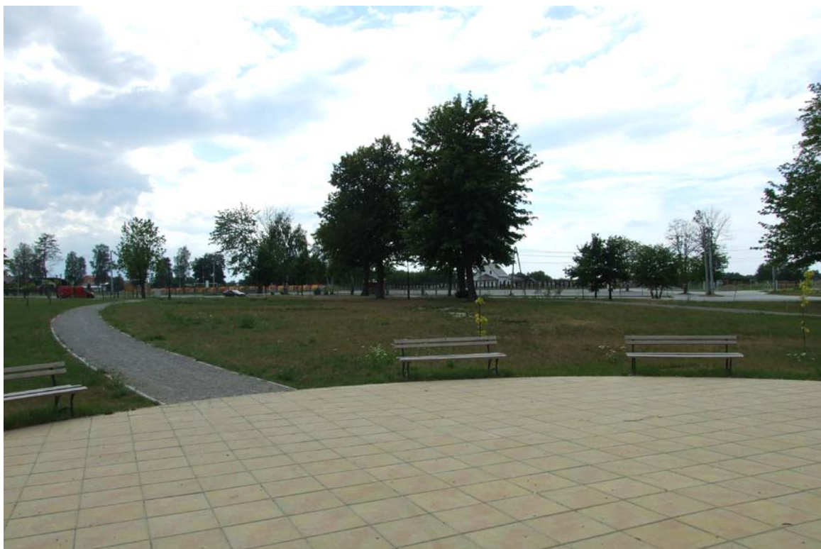
Fragment parku w Bratkowicach.

BRATKOWICE – zintegrowana wieś, dzięki więzom międzypokoleniowym, z dużym potencjałem rozwojowym, otwarta na innowacyjność. Wieś bezpieczna i przyjazna z bogatą tradycją kulturową i historyczną.