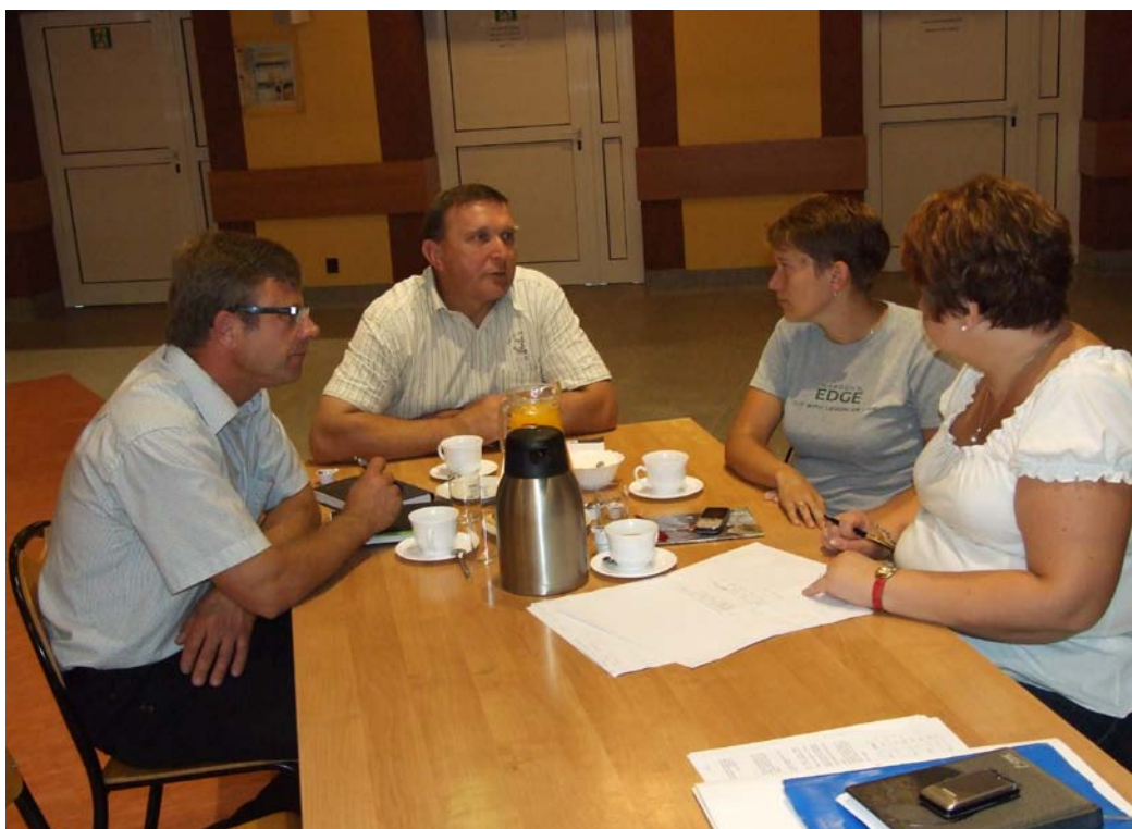
Grupa Odnowy Wsi w trakcie warsztatów.

Szkolenie uzyskało wśród uczestników bardzo wysokie oceny – średnia 4,98. Wszystkie elementy warsztatu z wyjątkiem możliwości wymiany doświadczeń oceniono na 5,0 pkt.