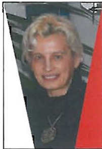
Autor: Teresa Garland