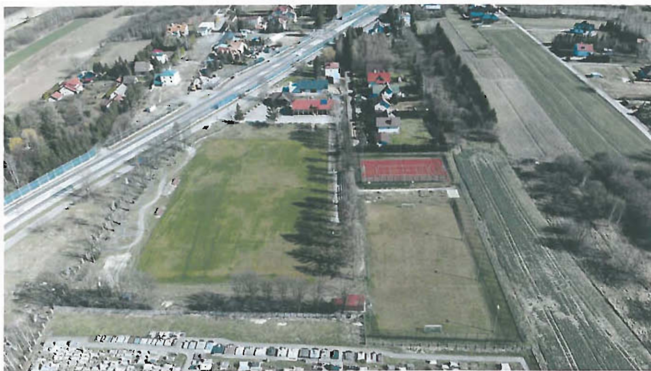
Fot 4. Stadion sportowy z kompleksem boisk