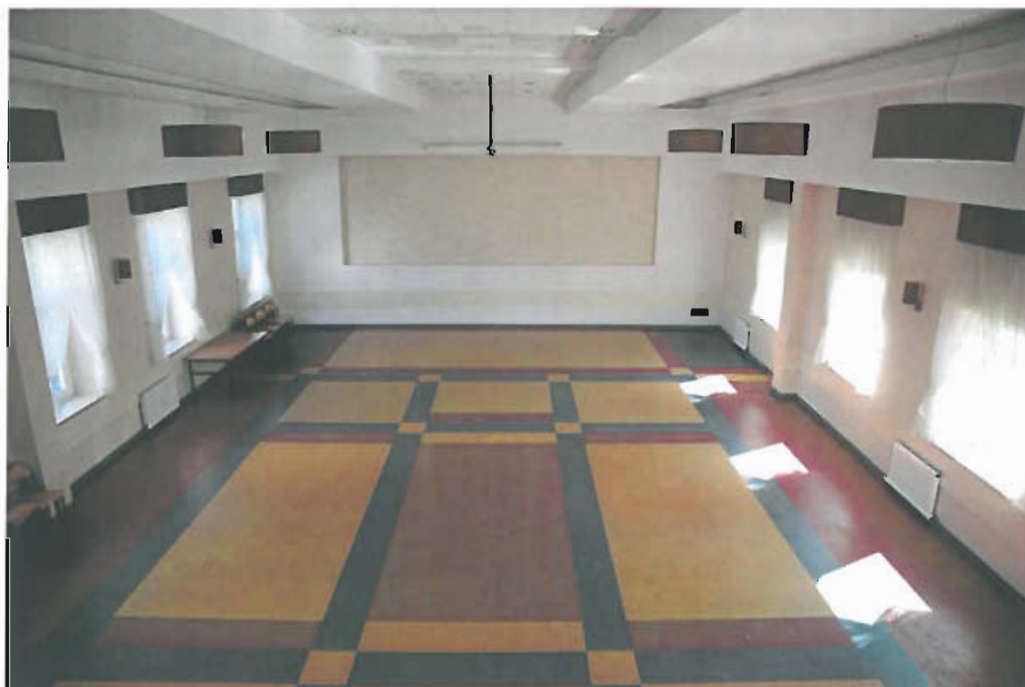
Fot 2. Sala widowiskowa GCKSiR