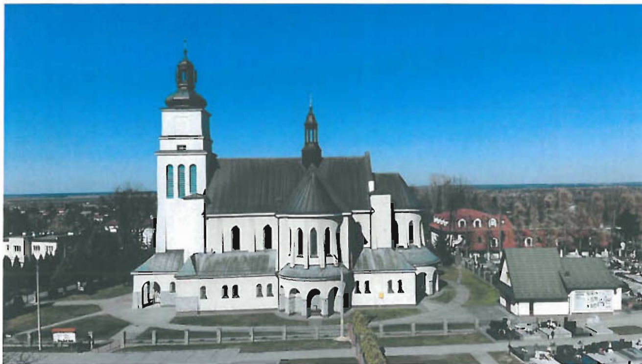
Fot 1. Kościół parafialny