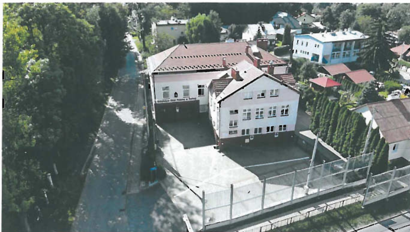
Fot 8. Filia GCKSiR, w tle budynek Ośrodka Zdrowia

PRZEWODNICZĄCY RADY GMINY mgr Piotr Wanat