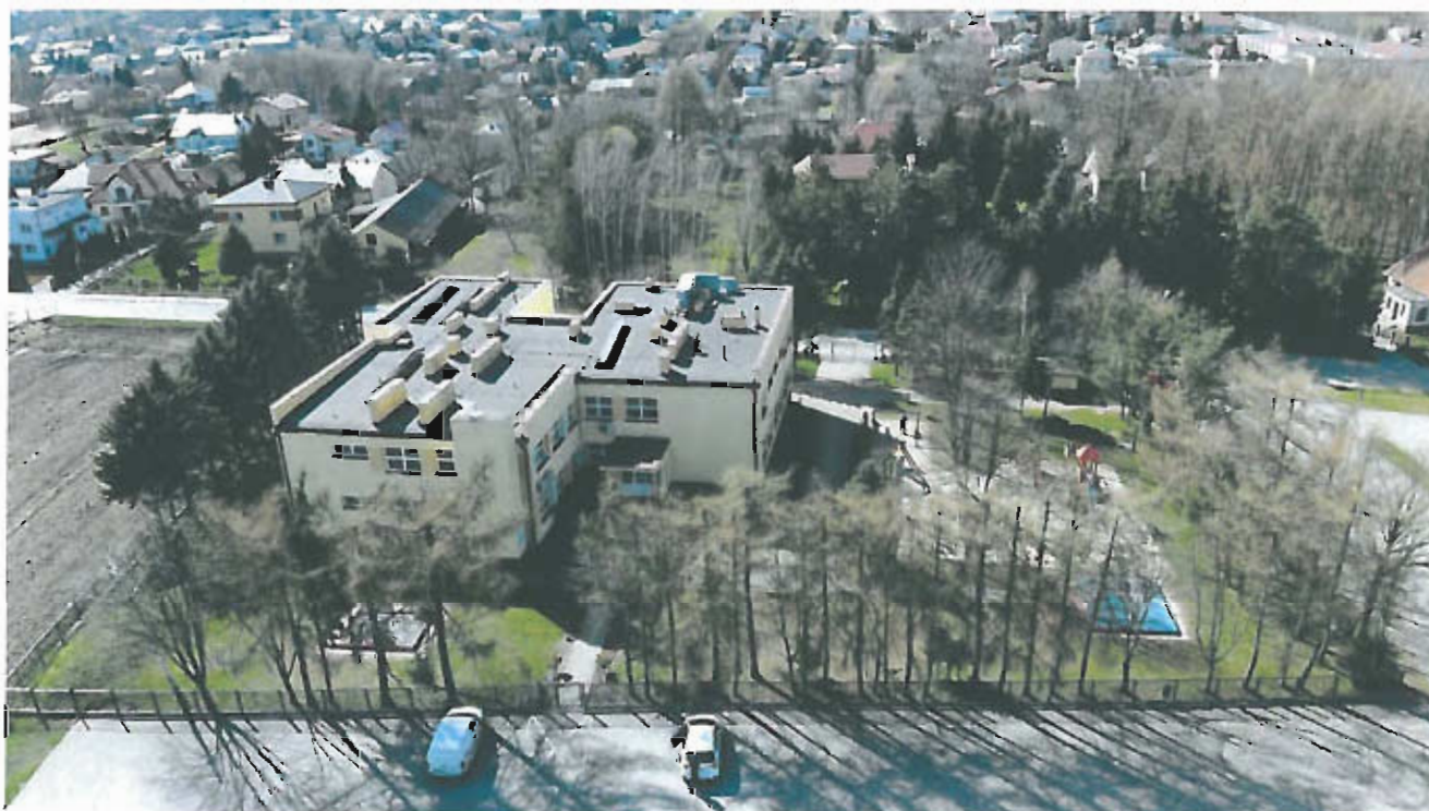
Fot 6. Przedszkole Publiczne