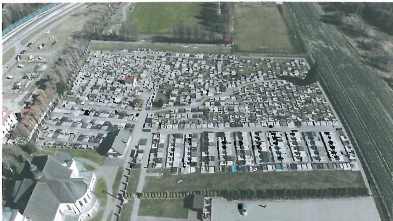
Fot 3. Cmentarz parafialny