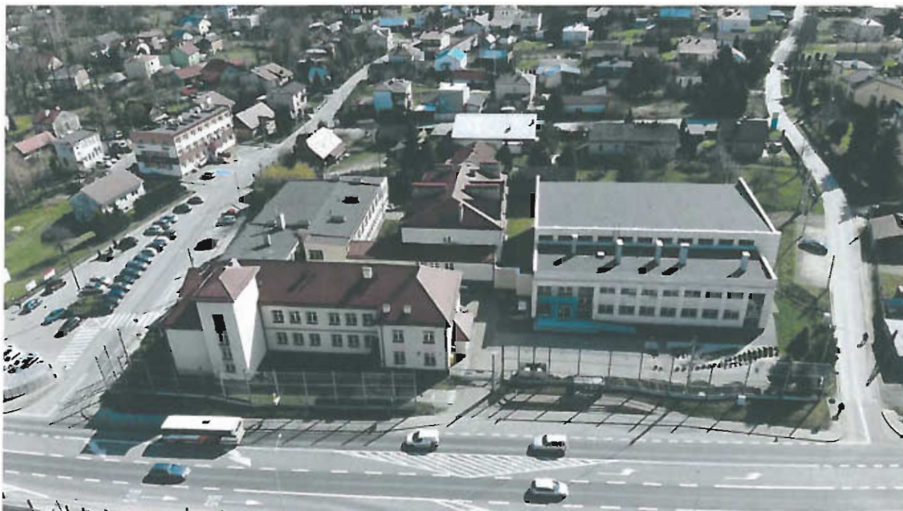
Fot 5. Szkoła Podstawowa