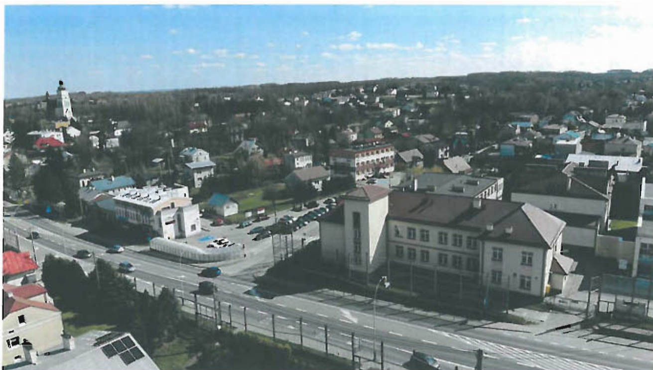
Fot 7. Widok na centrum wsi. Na pierwszym planie szkoła, widoczny Urząd Gminy, Euroregionalne Centrum Informacji Gospodarczej, Kulturalnej i Turystycznej oraz kościół parafialny